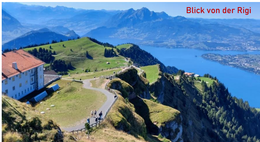
Blick von der Rigi